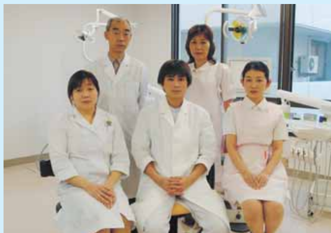
歯科・口腔外科のスタッフ

※口腔外科を主体とした診療体制のため、紹介状をお持ちでない一般歯科の患者さんはお断りする場合があります。