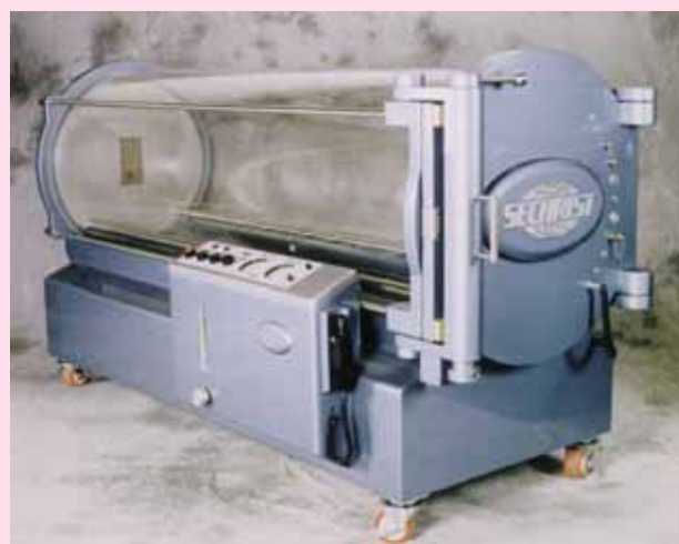
高気圧酸素療法装置