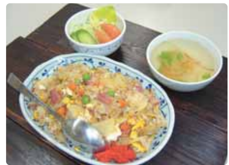
院長ピラフ～ババリア風～ ¥500 (スープ・ミニサラダ付)