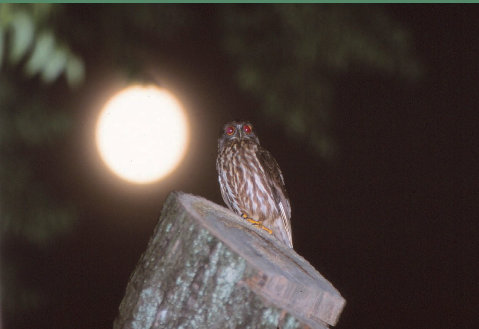
「月とアオバスク」

Sasebo Kyosai Hospital Communication Paper