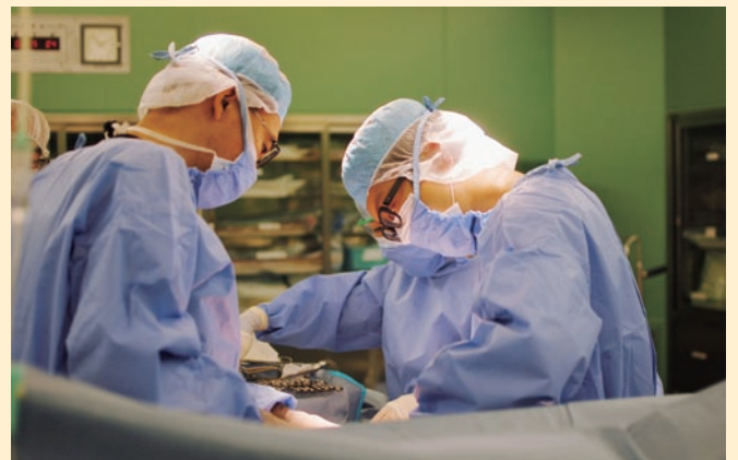
開業医の先生（左）との帝王切開術の様子

ただし、課題もあります。帝王切開時に新生児の管理を行う小児科医の数が少なく、手術日の選定に制約があることです。小児科の診療体制が充実し、本システムがもっと発展して正常分娩にも適用されるようになれば、懸念されている周産期医療体制の衰退にも歯止めがかけられるのではないかと思います。