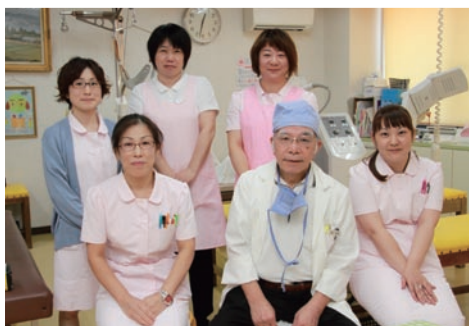
先生とスタッフの皆さん

さらに、乳癌、肺癌、大腸癌や前立腺癌の検診事業を積極的に行っております。時代が変わり医療の高度化が進むと、高度先端医療を行う専門病院と私達開業医の役割分担がはっきりしてきました。私達は可能な限り早く患者さんの重症度を見抜き、一分でも早く専門病院へ紹介を行わなければならない時代になりました。以前の「夕方6時以降は診察しないかかりつけ医」というイメージから、今や「緊急時かかりつけ医」としての大きな役割が求められる時代となってきたのです。従って、それらを確実に実行するためには、どの疾患の専門医がどの病院に存在しているか、そして可能な限り24時間オープンチャンネルの状態であるかが必要になってくると思います。佐世保市内でもこの10年間、着々とそうした緊急事態への対応システムが整備されつつありますが喜ばしい限りです。